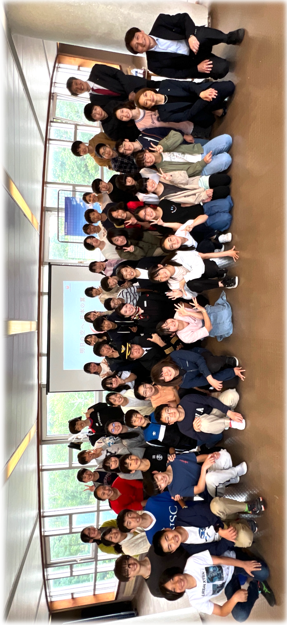
2024/6/18 職業講話 JALの皆さんと