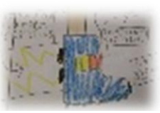
かつなり 「ばくそくダッシュブーツ」