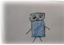
あさひ 「おてつだい」