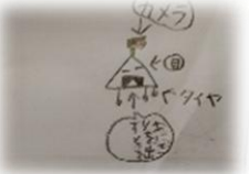
しょうた 「おにぎり」