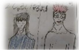
けん 「いっしょにいてくれる」