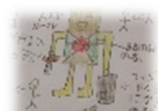
えいいち 「めちゃくちゃ強い～」