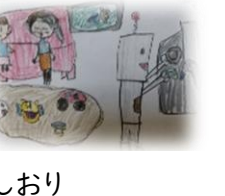
しおり 「おてつだい」