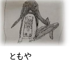
ともや 「ぺんぎんがたじゅわき」