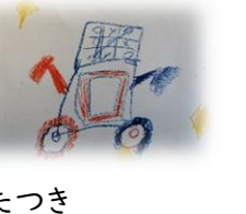
たつき 「104あんないそうじ」