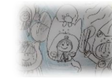
いろは 「空中子ねこ」